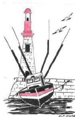
Une des toiles réalisée par Claude