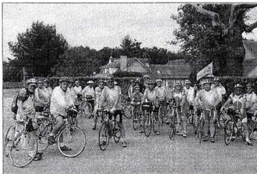
DÉTENTE. Les cyclos au départ du centre Azureva..

Cette amicale, affiliée à la Fédération française de