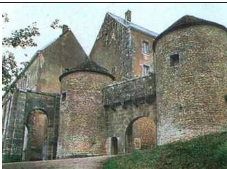
Flavigny s/Ozerain,, un des plus beaux villages qu'ont découvert les participants des Journées Brégeron en Bourgogne